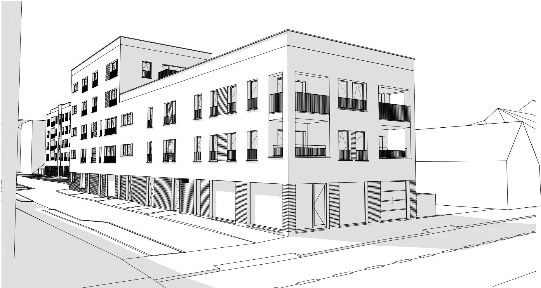
VUES 3D - RUE DES TREFLES