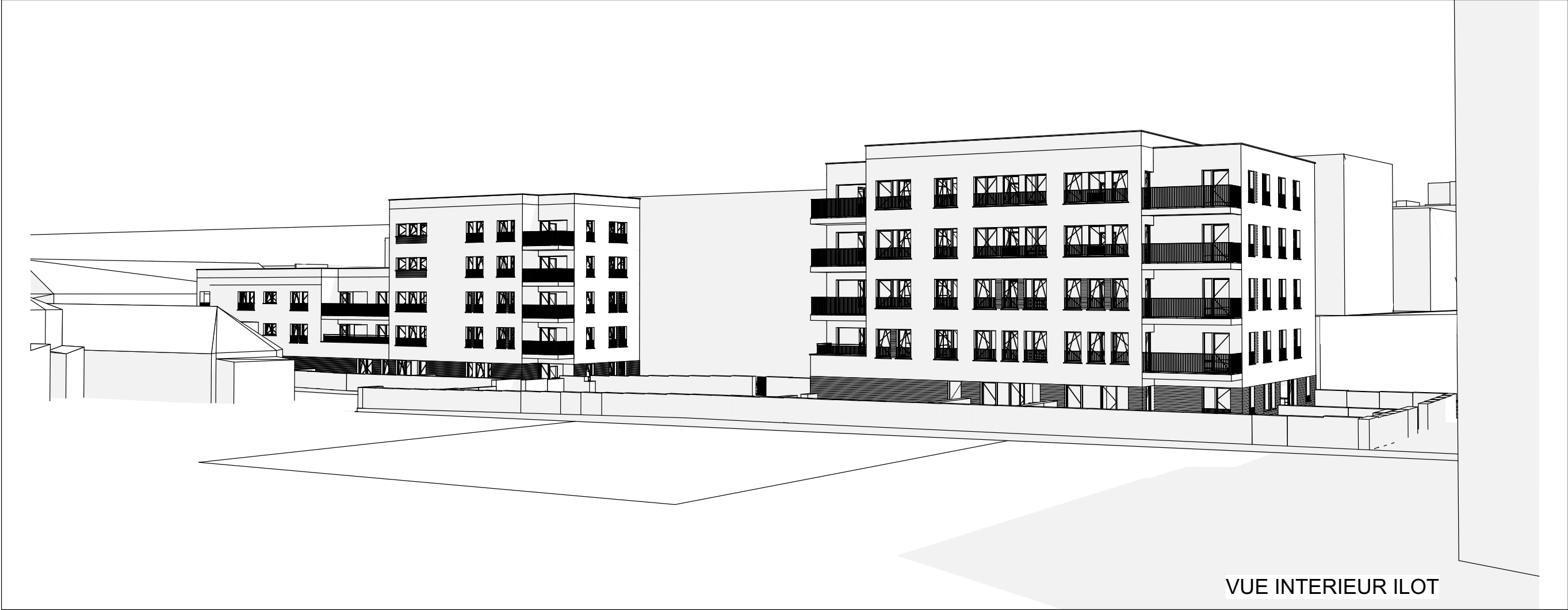
VUE INTERIEUR ILOT