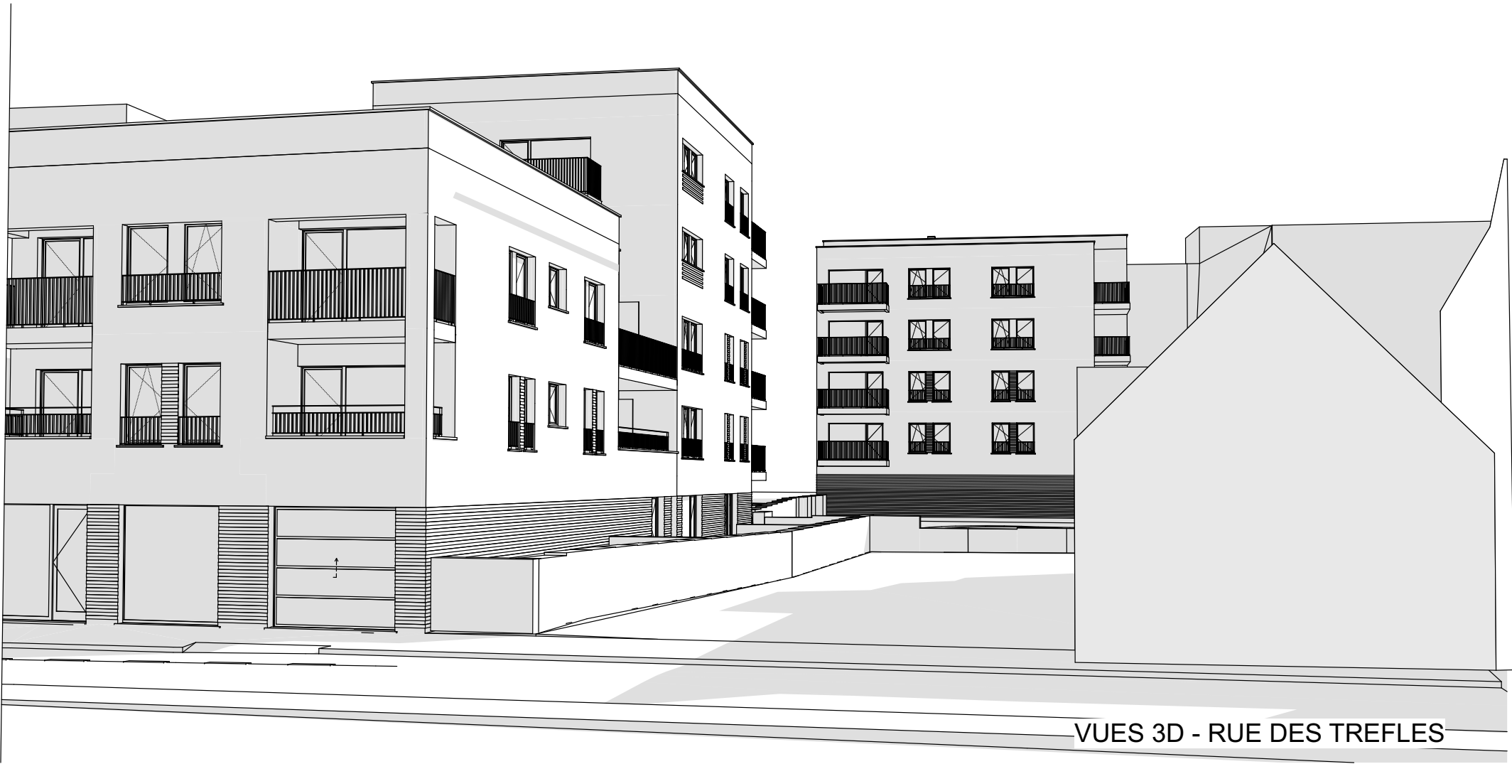
VUES 3D - RUE DES TREFLES